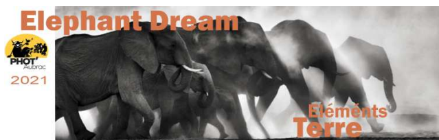
Elephant Dream - La quête part II © Kyriakos Kaziras

Ces deux expositions majeures sont, chacune dans leur style propre, une source de réflexion sur le devenir du monde vivant dont nous faisons partie intégralement ... C'est donc la question de notre propre avenir / devenir qui est posée.